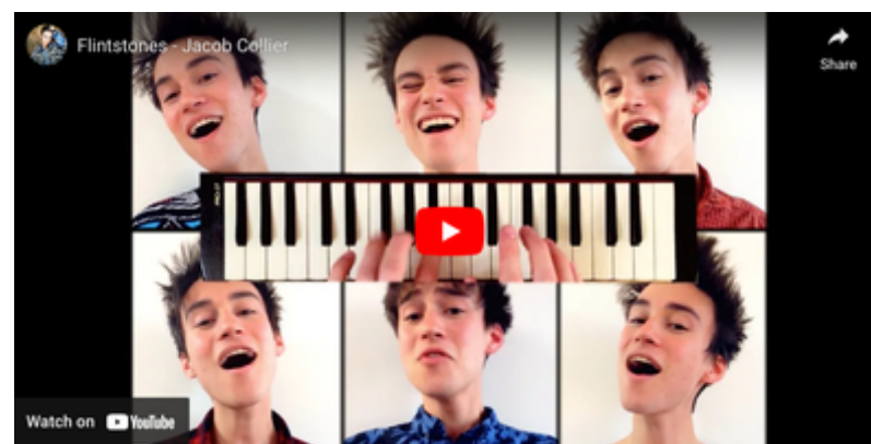
Jacob Collier - Flinstones

https://www.youtube.com/watch?v=zua831utwMM