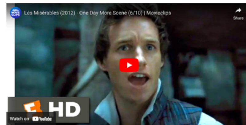
Les Misérables - One Day More

https://www.youtube.com/watch?v=Sv-BxH3SVS8